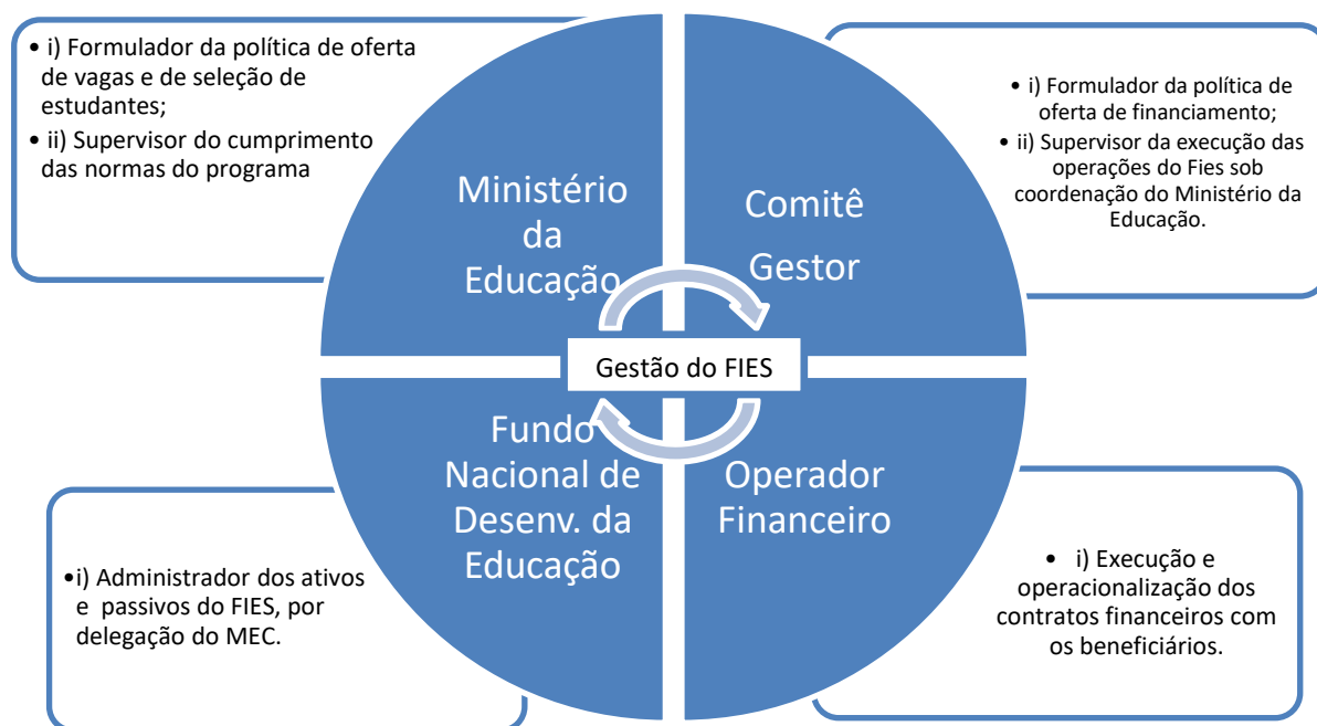
Figura 1 - Gestão do Novo FIES

política, destacam-se também as instituições de ensino superior (IES) e os estudantes, pois são eles quem estão na ponta da política pública. Abaixo, a figura demonstra os atores que estão envolvidos na gestão do programa e suas respectivas competências: